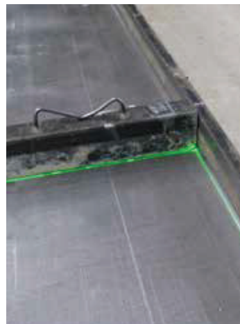
Positioning with Laser light Positionierung mit Laserlicht

bedded parts and reinforcement. The lasers in the precast plants save the users on site the time-consuming manual measurement of the positions for the formwork, empty pipes and built-in components. Directly 1: 1 from the CAD, the contours are projected on the tables. The projection makes it possible for the workers on site to use the components immediately. The installation of the laser is fix above the table or on rails for long tables.